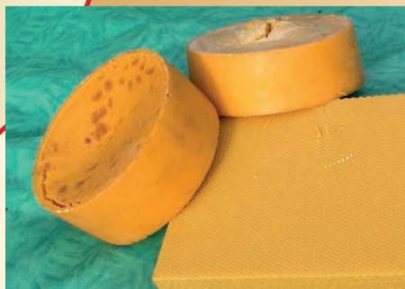
Schweiz. Bienen-Zeitung 1/2012

Die Säcke mit dem zu schmelzenden Waben und Wachs müssen mit der Aufschrift «Seuchenstand Sauerbrut» deutlich gekennzeichnet sein. Wiederverwertendes Wachs muss in einem Autoklav bei einer Temperatur von mindestens 121°C für 30 Minuten sterilisiert werden.